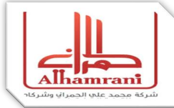
شركة محمد علي الحمراي وشركاه