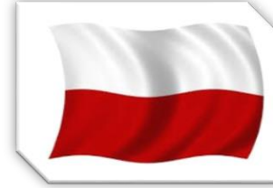
سفارة دولة اندونيسيا