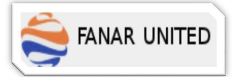
مجموعة فنار المتحدة