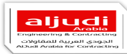
شركة الجودي العربية للمقاولات